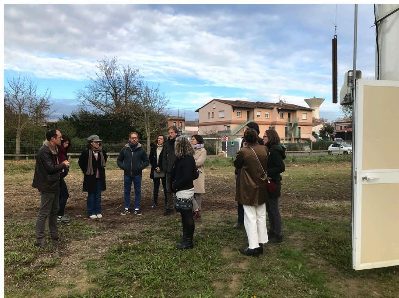
L'atelier du 6 décembre 2022 à Fenouillet - Visite de l'Ecopôle alimentaire Cocagne

Le rôle des collectivités s'avère également nécessaire pour faire le lien entre les projets d'installation et les